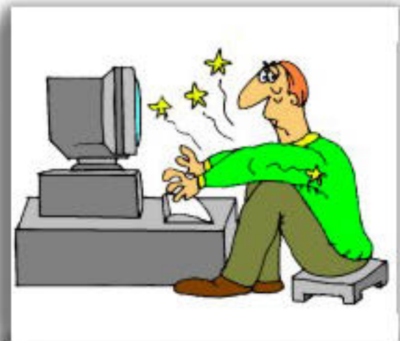
Posizione di lavoro inadeguata