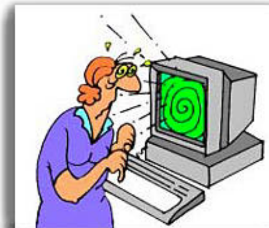
Fissità visiva prolungata