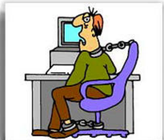
Posizione fissa prolungata